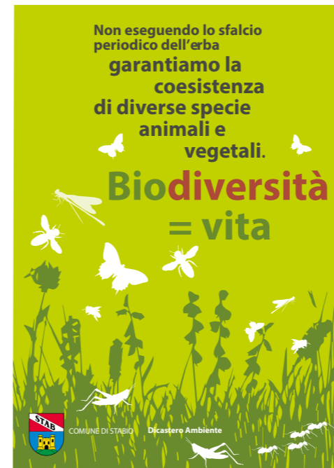
Uno dei pannelli che potreste trovare in prossimità di aree prative non sfalciate.

biodiversità nel nostro territorio da poter utilizzare a livello didattico con le nostre scuole, e forse, prossimamente ci saranno anche dei cittadini che dedicheranno un piccolo angolo del loro giardino per migliorare il nostro ecosistema.